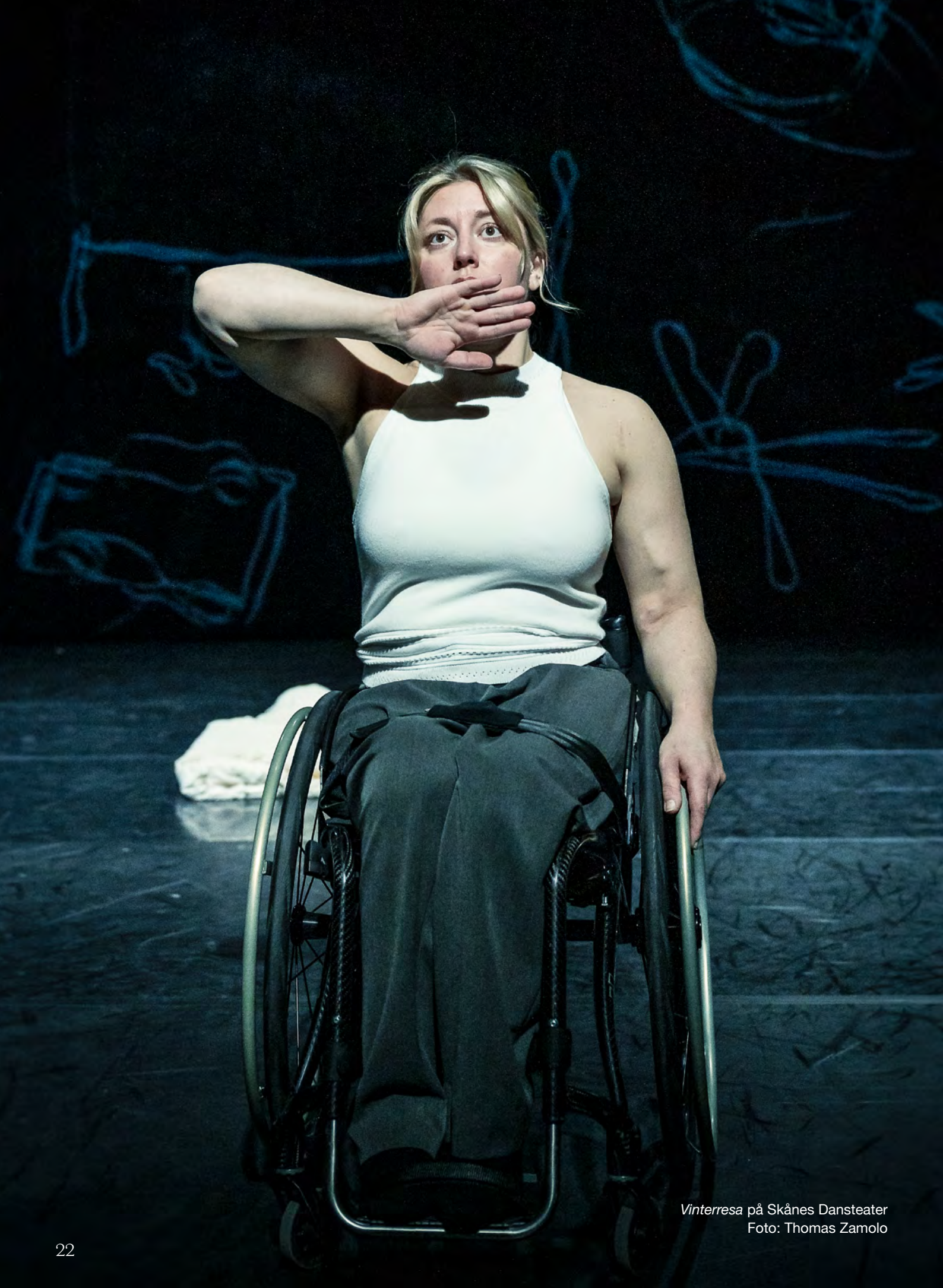
Vinterresa på Skånes Dansteater