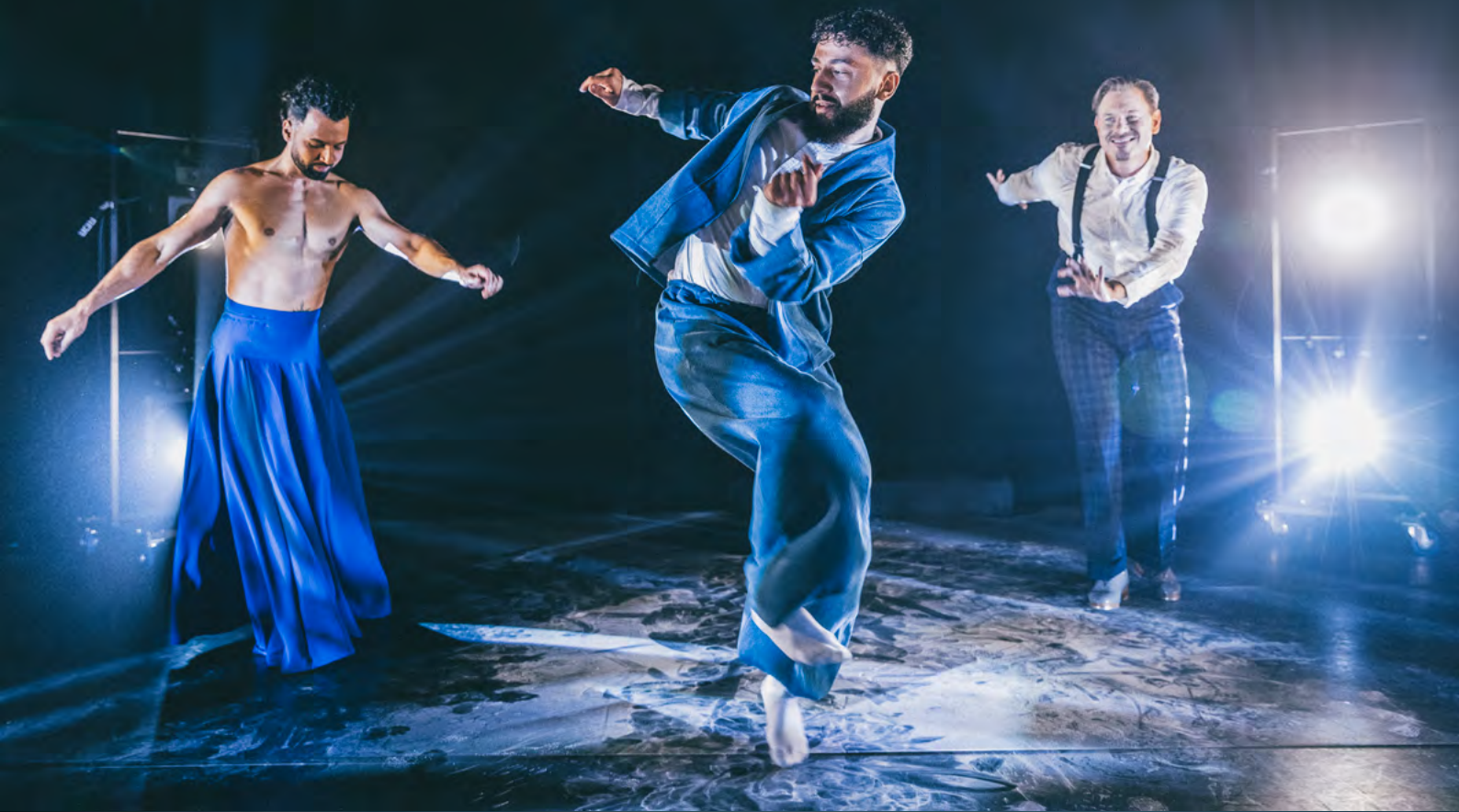
Pianotopografier med Riksteatern i samarbete med Rum för dans