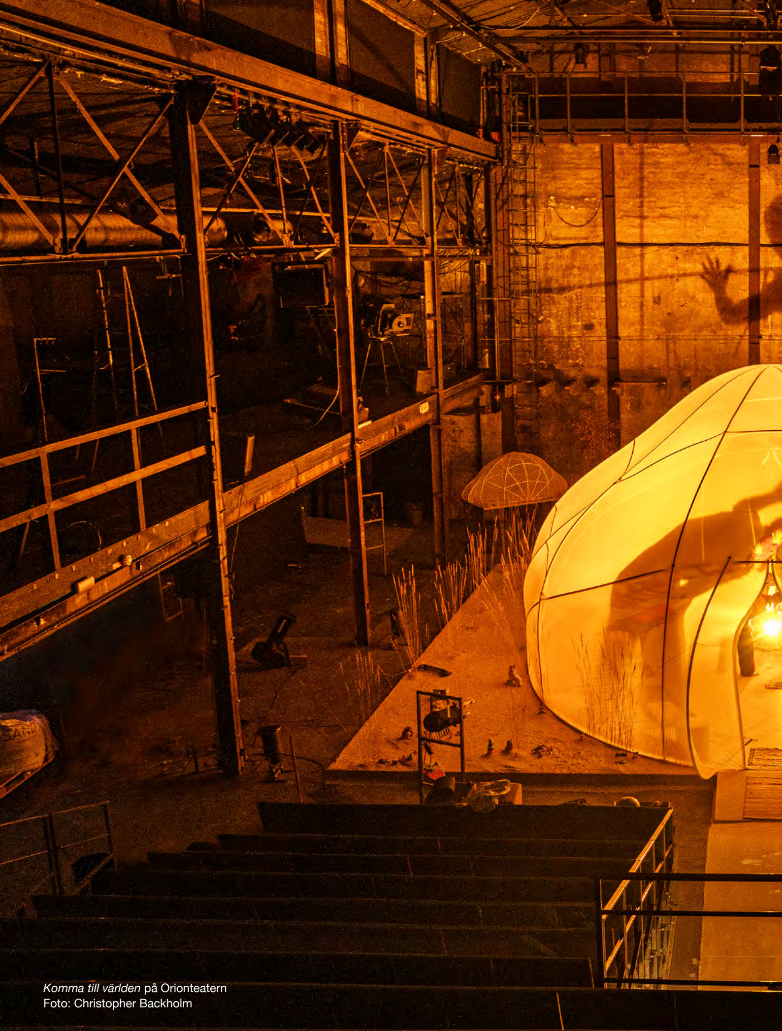
Komma till världen på Orienteatern