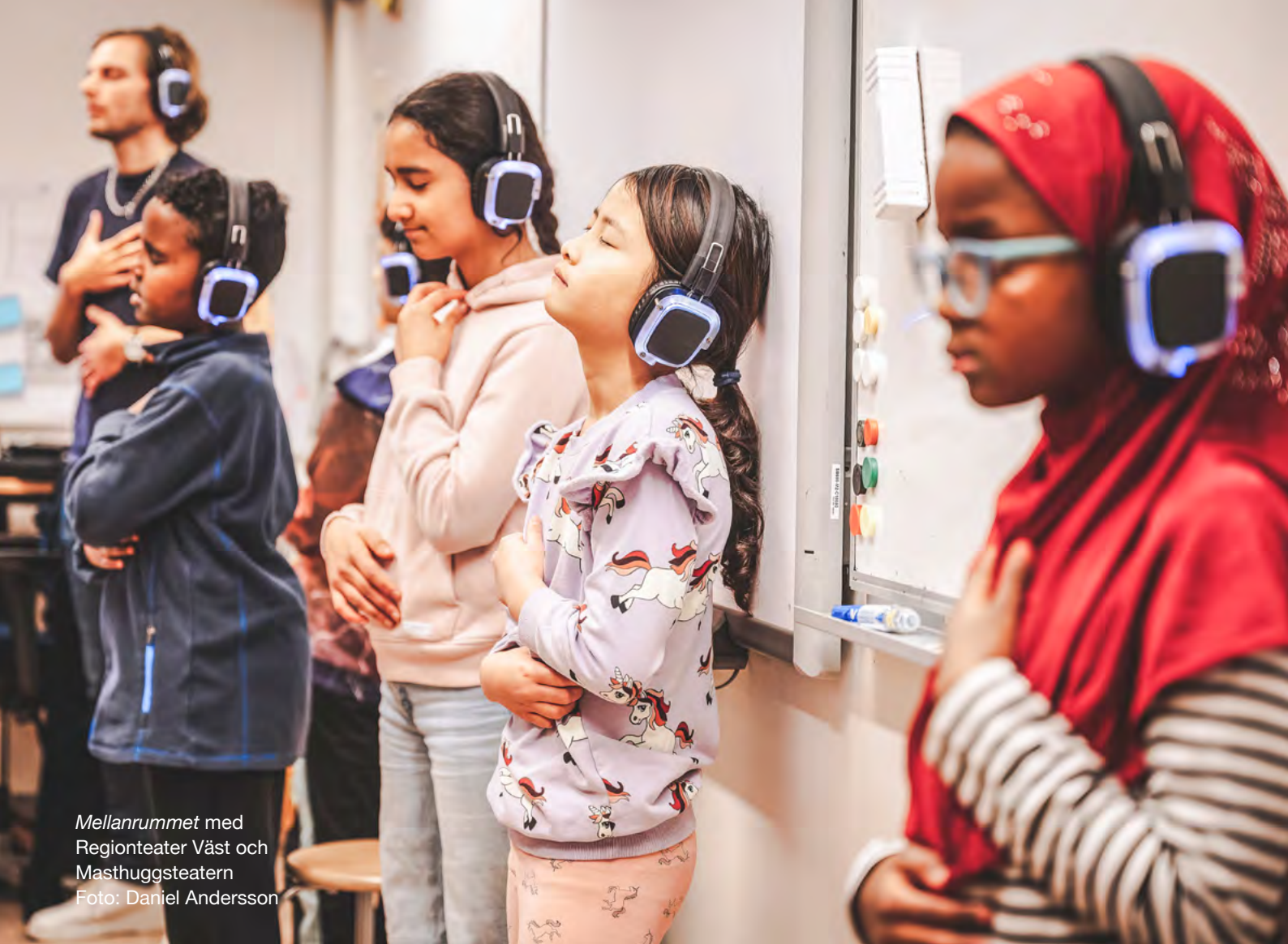
Mellanrummet med Regionteater Väst och Masthuggsteatern