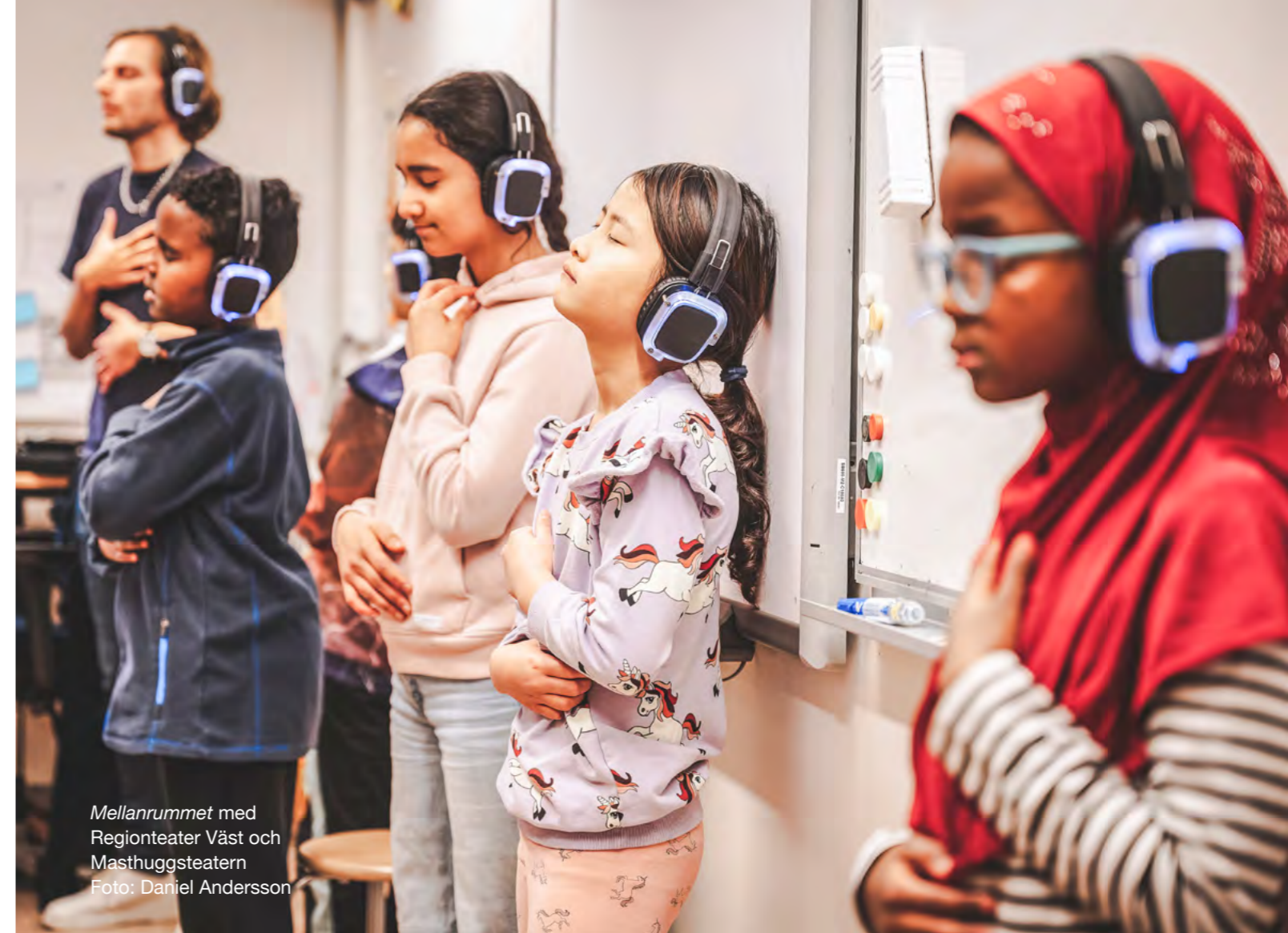
Mellanrummet med Regionteater Väst och Masthuggsteatern