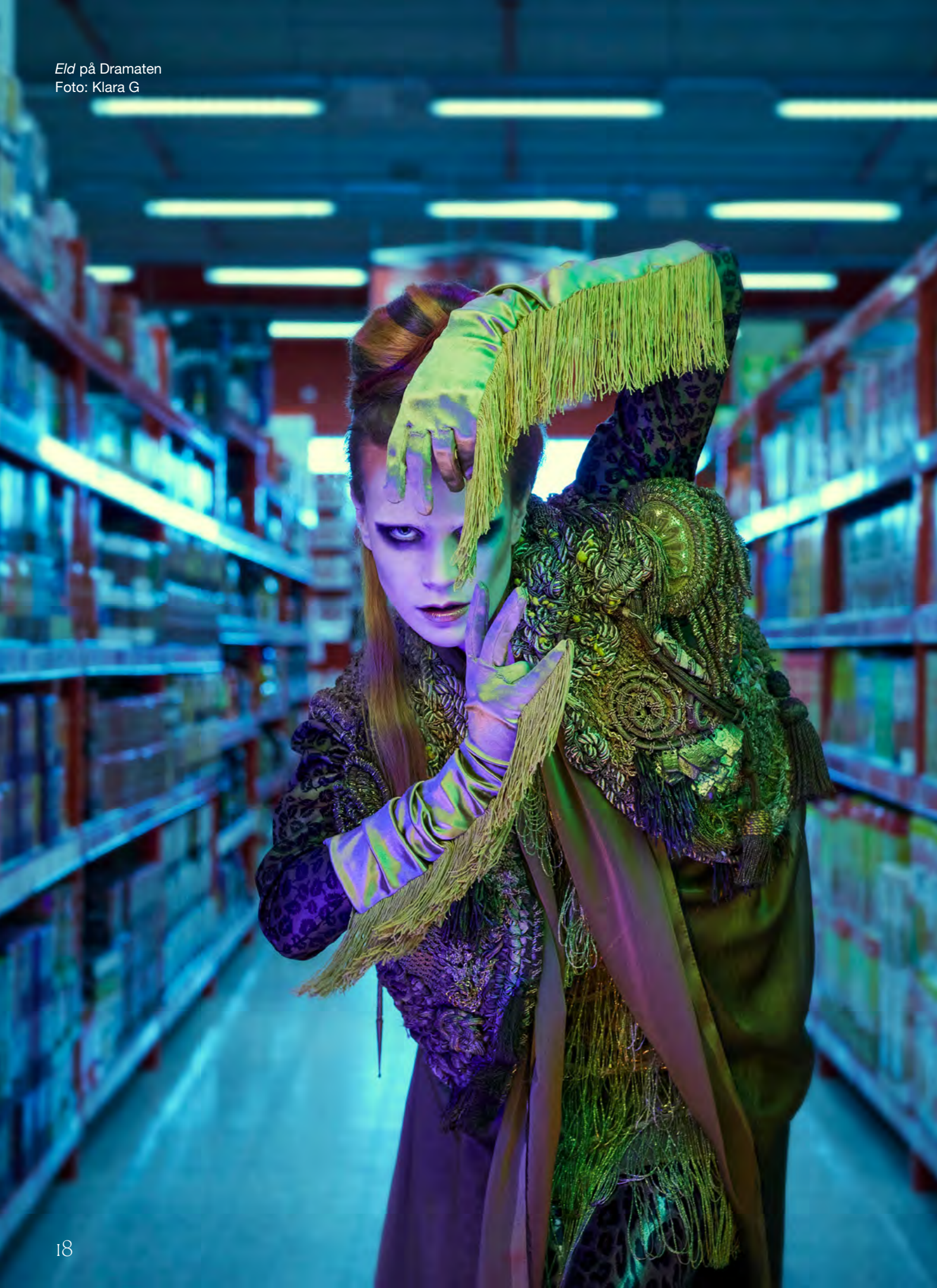
Eld på Dramaten