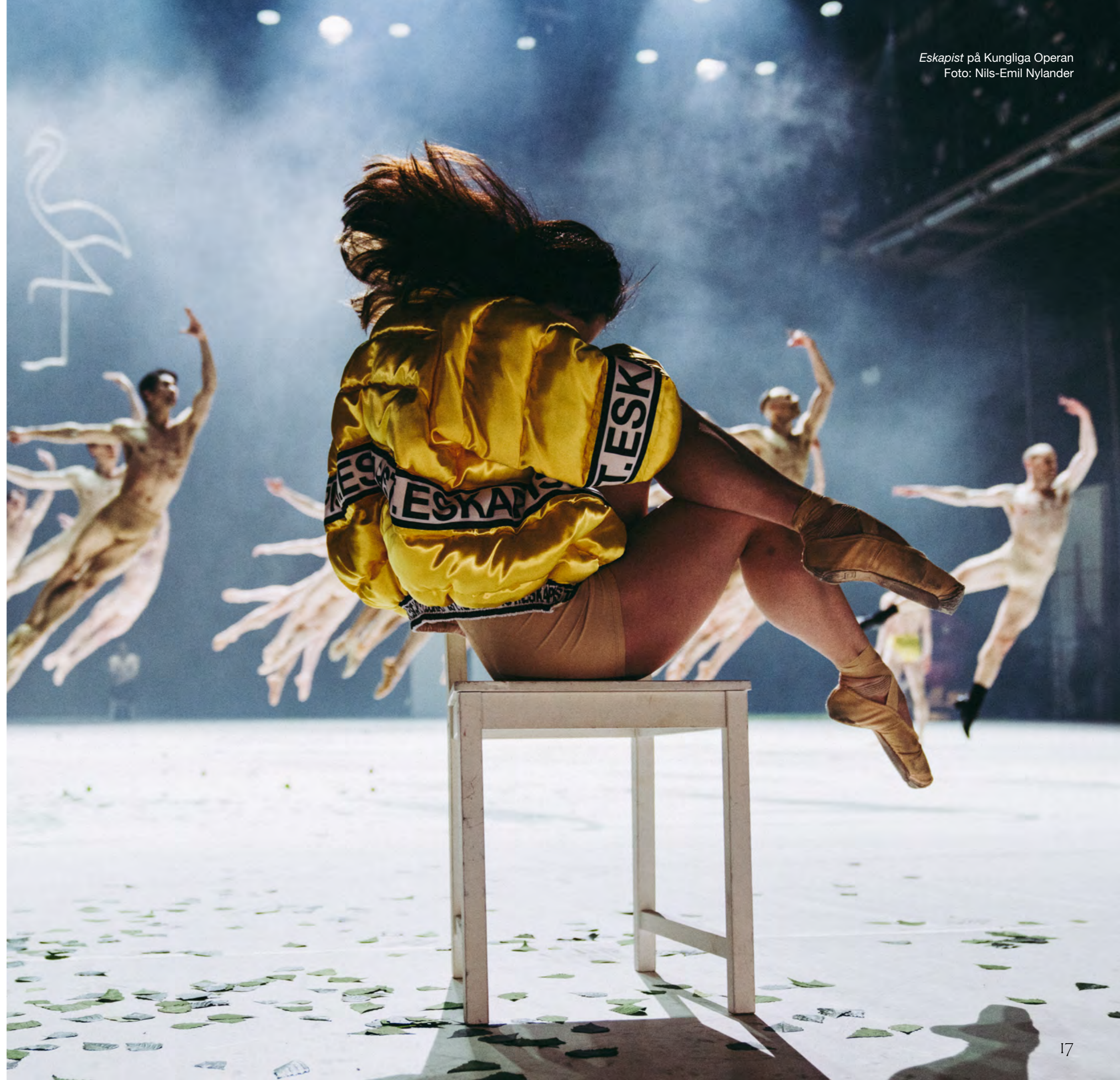
Eskapist på Kungliga Operan

Upphovsrättens och närstående rättigheters praktiska funktionalitet samt hur strukturen, maktbalansen och beräkningarna för ersättningar kring detta hanteras inom kulturlivet och de kreativa branscherna är komplext och skiljer sig till stora delar åt mellan konstområden och olika delar av denna företagssektor. Det är också viktigt att inte endast ha upphovspersonernas eller de utövande konstnärernas perspektiv i dessa frågor, då berörda näringar och företag som har behov av att nyttja rättigheter måste kunna göra det till rimliga villkor för att fungera. På dessa punkter hade betänkandet vunnit på en mer nyanserad beskrivning.