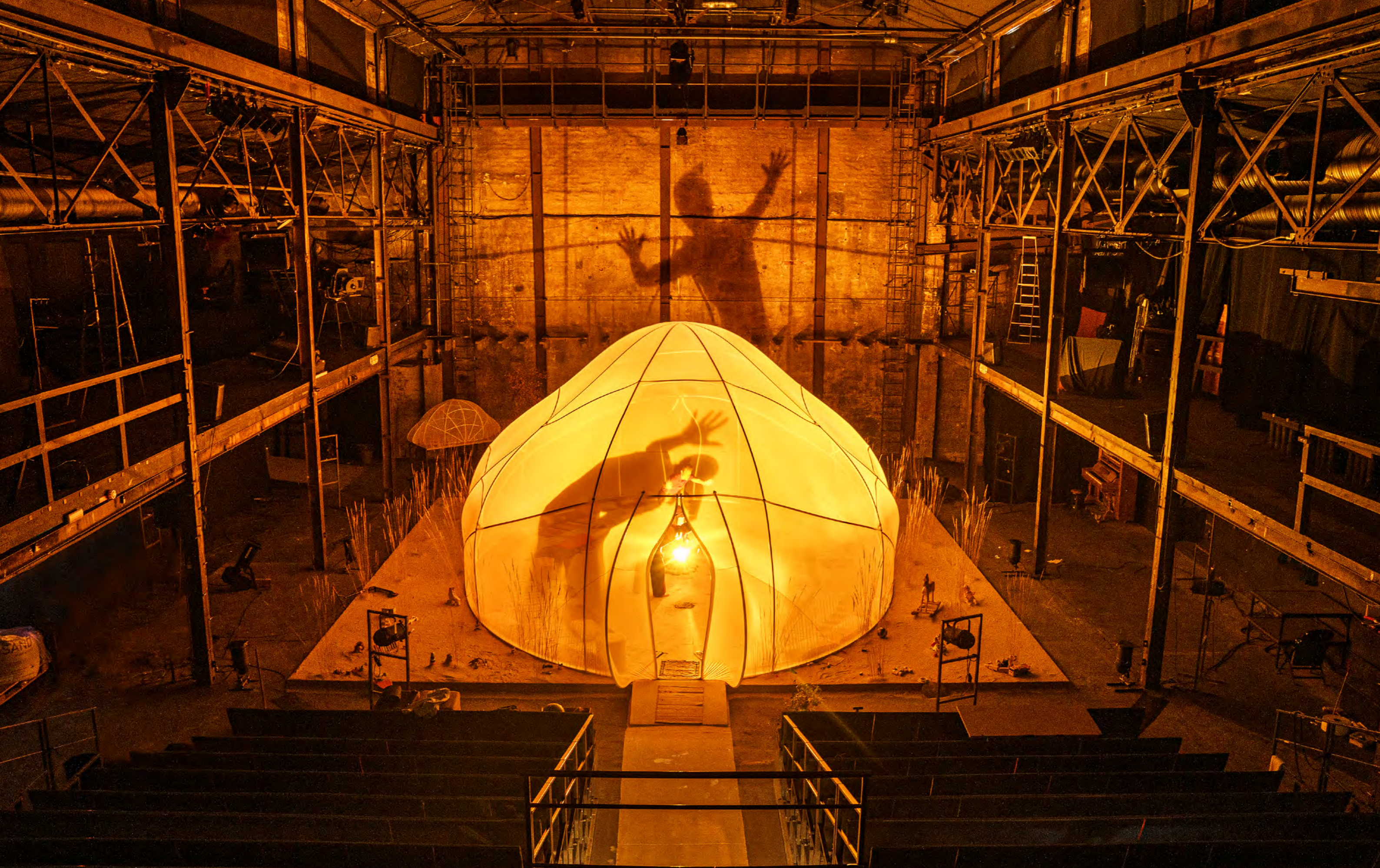
Komma till världen på Orienteatern