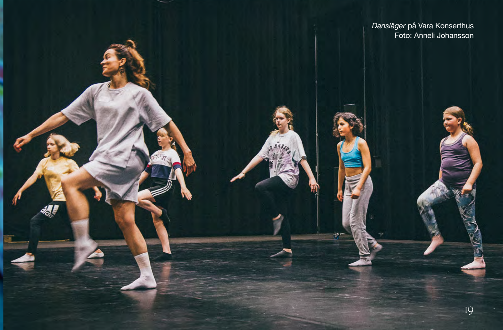
Dansläger på Vara Konserthus