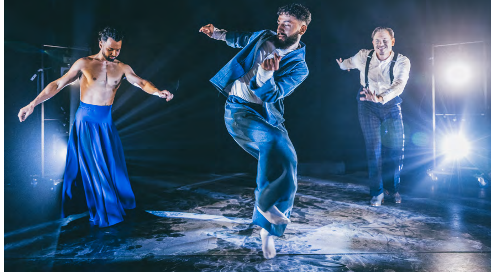
Pianotopografier med Riksteatern i samarbete med Rum för dans