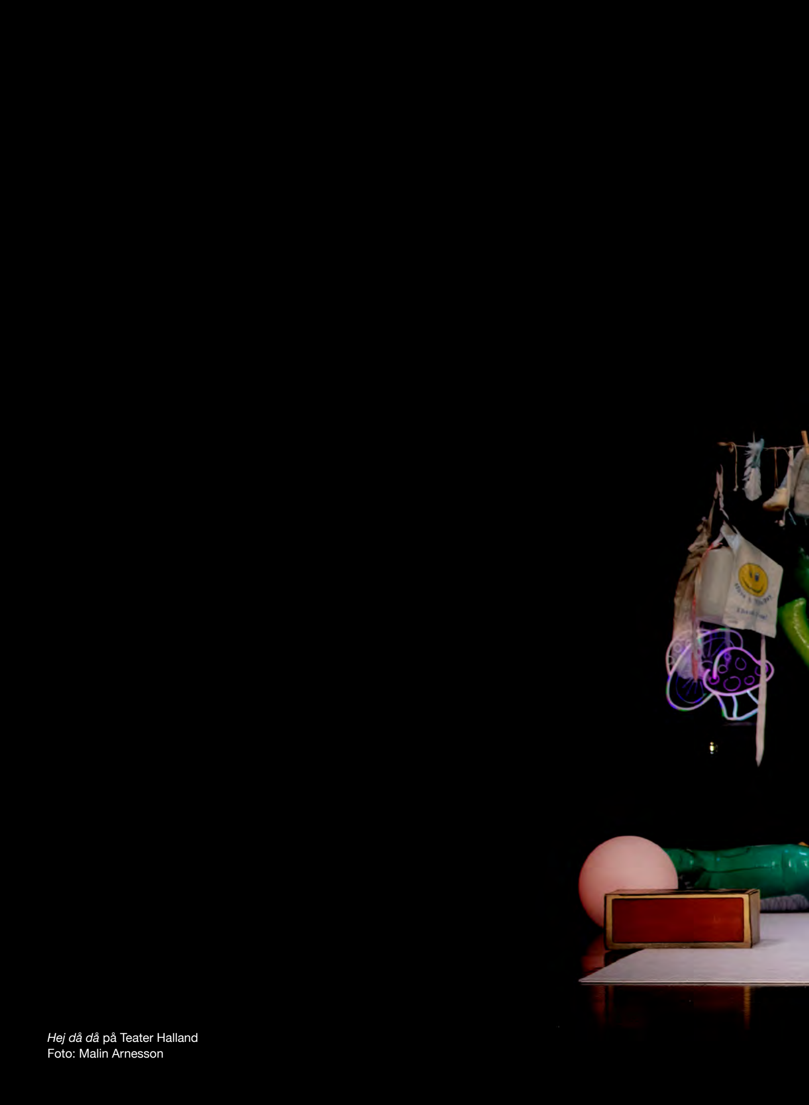
Hej då då på Teater Halland