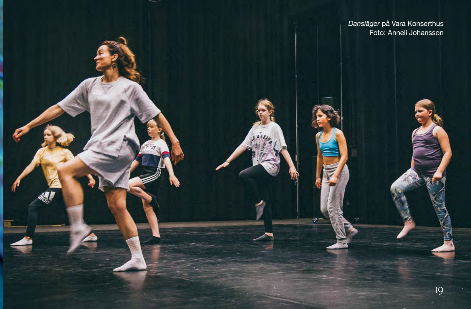
Dansläger på Vara Konserthus