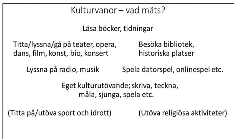
Figur 1. Sammanställning av vad kulturvaneformulären ställer frågor om.

Genomgången av de utförda undersökningarna har visat att kultur indirekt definierats på ett visst sätt. 32 Det kan vara värt att kort granska denna definition. Trots variationen som finns i formulärens mäts i huvudsak samma fenomen. I figuren nedan sammanfattas det man frågat efter i de nordiska studierna.