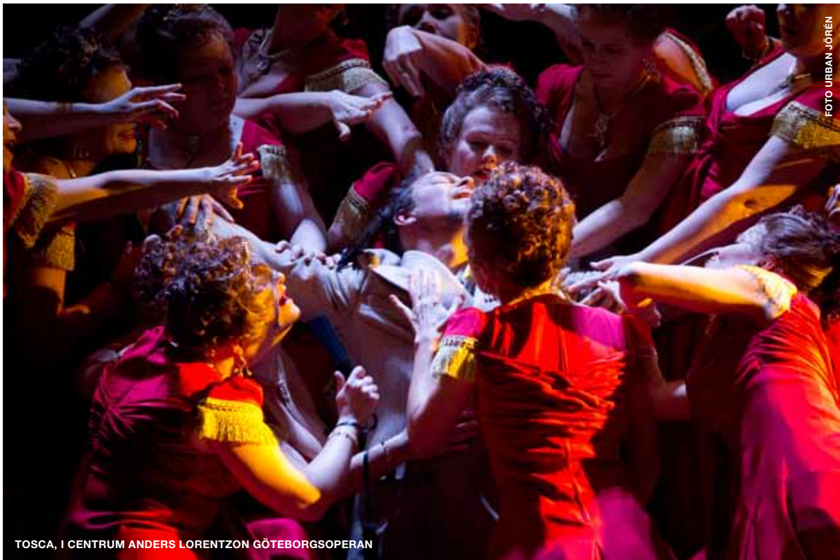
TOSCA, I CENTRUM ANDERS LORENTZON GÖTEBORGSOPERAN