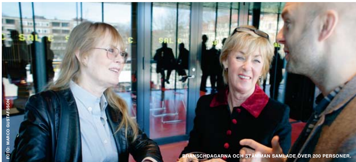
BRANSCHDAGARNA OCH STÄMMAN SAMLADE ÖVER 200 PERSONER.

Operakonstens utveckling och möjligheter (externt)