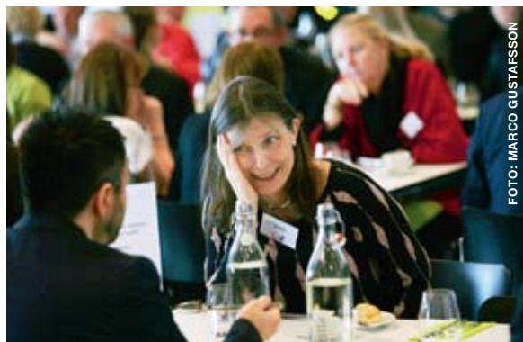
KULTURUTREDNINGEN – ETT HETT ÄMNE VID STÄMMAN.

Inom socialförsäkringsområdet har Pearle bevakat frågor om arbetstidsdirektiv, föräldraledighetsregler, direktiv för