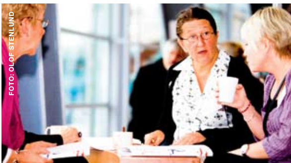
KONFERENS HUS FÖR SCENKONST I NORDEN, GÖTEBORG 2-3 NOVEMBER

effektiviseringsmöjligheter är uttömda tvingas man att se över även dessa kostnader. För flera av medlemsföretagen har det gångna året präglats av omfattande personalminskningar, både i form av minskat antal tillsvidareanställningar men också färre anställningar för frilansare. Allt tyder på att behoven av omstruktureringar kommer att fortsätta flera år framöver för att anpassa organisationerna till framtida behov och resurser.