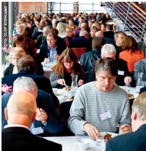
KONFERENSEN HUS FÖR SCENKONST I NORDEN SAMLADE 350 DELTAGARE.